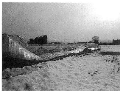
倒壊したハウスの状況

先月の大雪により特別災害指定された深谷市の農家を視察しました。プレハブ、鉄骨ハウスが無残にも倒壊し、丹精込めて育てたキュウリ、イチゴ、ユリの花等が多大な損失を受けました。被災された農家の再建・継続には多くの支援と時間が要すると思います。国等では被災農業者への支援対策を実施しています。災害関連資金の5年間無利子貸付、ハウスの撤去・再建修繕への助成等です。心が折れなければとつくづく思いました。