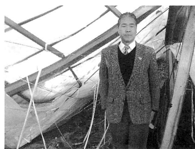
鉄骨ハウスと被害の深刻さ